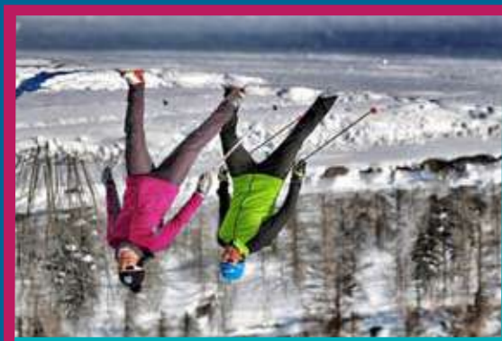
Plan des pistes