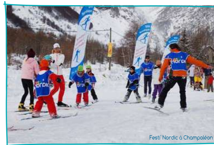
Festi' Nordic à Champoléon