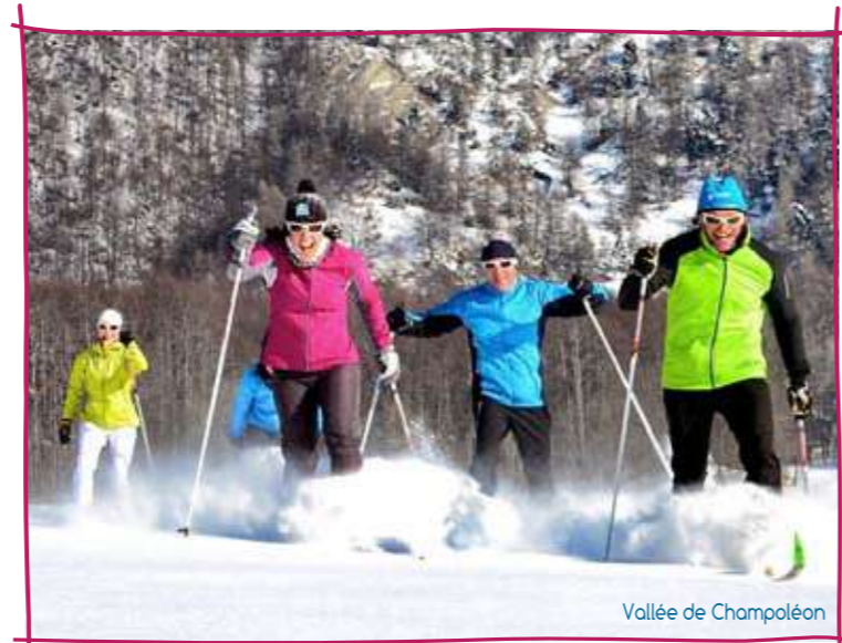
Vallée de Champoléon

Pour les noctambules, des projecteurs éclairent une piste de border cross à Chauffarel chaque vendredi soir.