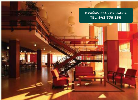
BRAÑAVIEJA - Cantabria TEL.: 942 779 250

SERVICIOS: restaurante, cafetería, salones sociales, disco-bar, terraza solarium, sauna, parking...